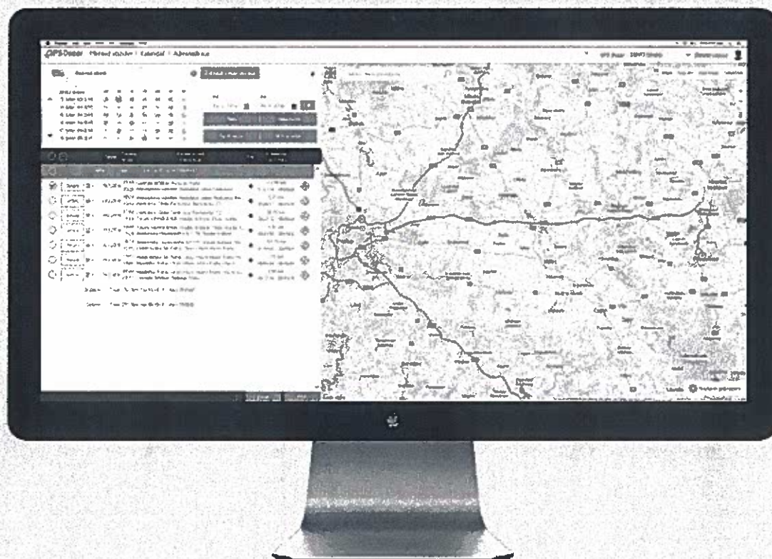
Náhled do elektronické knihy jízd

Elektronická kniha jízd je pravidelně zálohována, aktualizována a pro její údržbu nepotřebujete žádné další aplikace kromě Vašeho internetového prohlížeče.