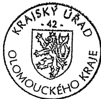
Ing. Bohuslav Kolář, MBA vedoucí odboru Krajský úřad Olomouckého kraje

Proti tomuto rozhodnutí lze podle § 81 zákona č. 500/2004 Sb., správní řád, ve znění pozdějších předpisů, podat odvolání do 15 dnů ode dne doručení rozhodnutí, odvolání se podává u Krajského úřadu Olomouckého kraje, odboru zdravotnictví, o odvolání rozhoduje Ministerstvo zdravotnictví ČR.